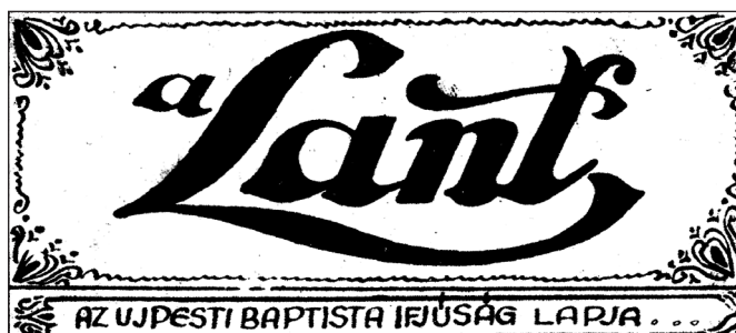
Az első fejléc 1936-ból