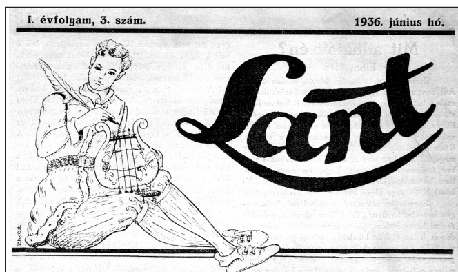
A második fejléc 1936-ból