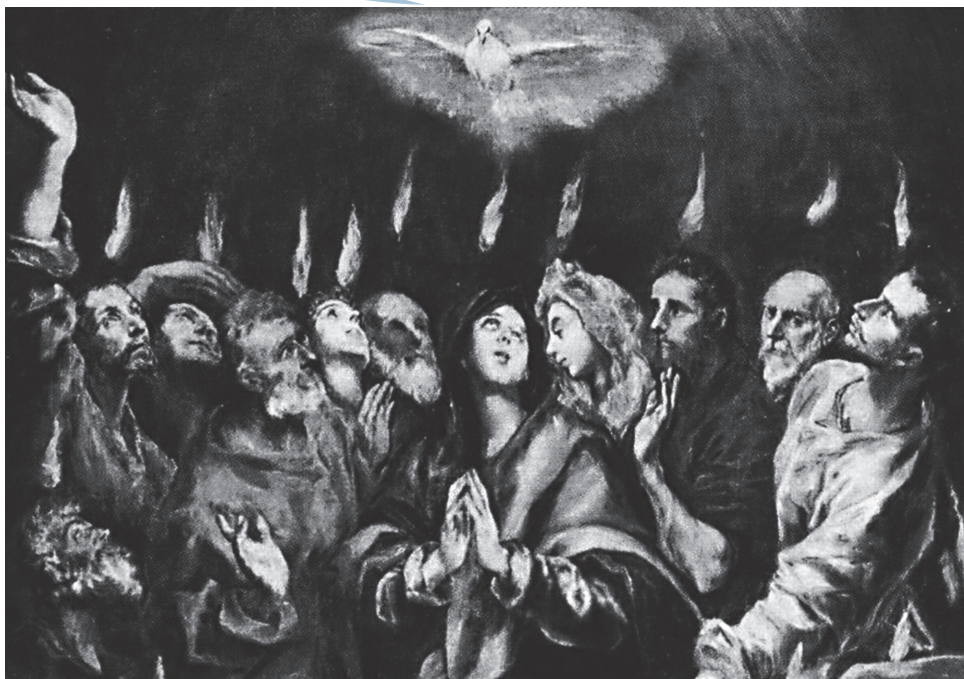
El Greco: Pentecost