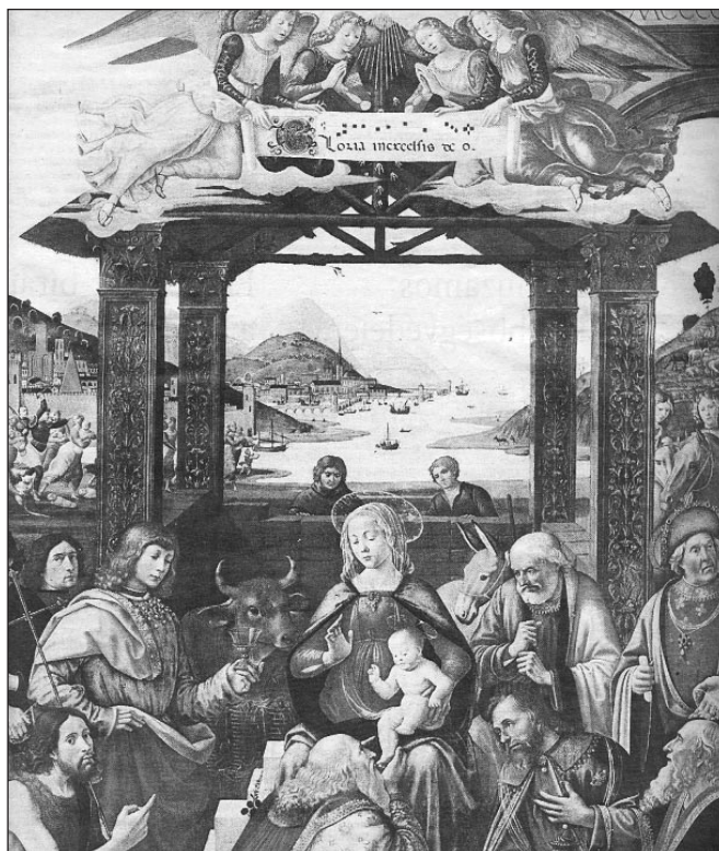
Domenico Ghirlandaio: A királyok imádása