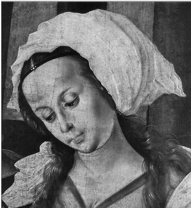
MS mester: Jézus születése – részlet

terhét biztosan elviszi Betlehembe. A végtelennek tűnő zarándoklat idején Mária biztos abban, hogy amit az Úr elgondolt, azt véghez is viszi. És az útszéli fügefák, datolyapálmák és más lédús gyümölcsök erőt és táplálékot adnak, a cédrusfák betakarják őket ágaik árnyékával, és lábuk alatt fogy az út.