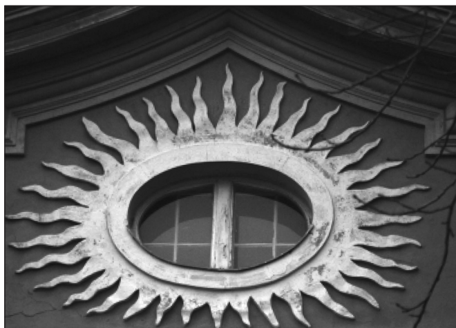
Budapest, Tóth Árpád sétány