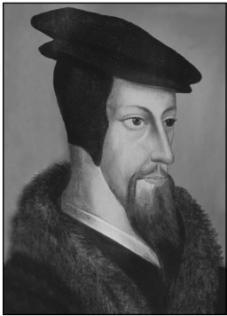
Kálvin János 1509–1564

2009-ben Kálvin Jánosra emlékeznek a református világ az egyházalapító születésének 500. évfordulója alkalmából. Az ünneppsorozat egészen 2014-ig tart majd, amikor is a reformátor halálának évfordulójáról is megemlékeznek. A magyar reformátusok jubileumi kiállítással, emléklakett kiadásával, rajz- és novellapályázattal, és Kálvin életét, munkásságát és tanításait bemutató könyvek kiadásával emlékeznek a genfi reformátorra.